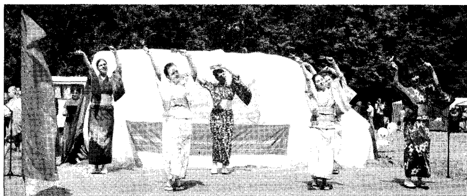
На праздничной сцене московские гости - ансамбль народного японского танца «Кисеки но хана»